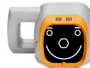
plusoptix S12R mobil ohne Schnittstelle