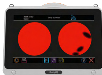
Beispielhafte Darstellung Durchleuchtungstest plusoptiX S20