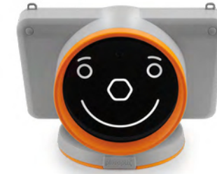
plusoptix S20 mobil mit Schnittstelle zu Praxissoftware (GDT)